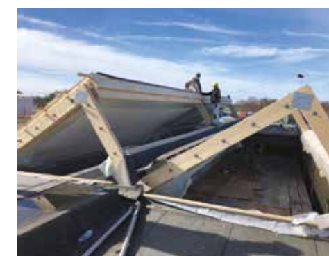
Montage af shedtag over atrium