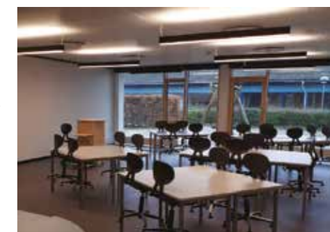
KLYNGE C ved ibrugtagning

Klynge B forventes dog også at være færdigt til ibrugtagning i juni måned.