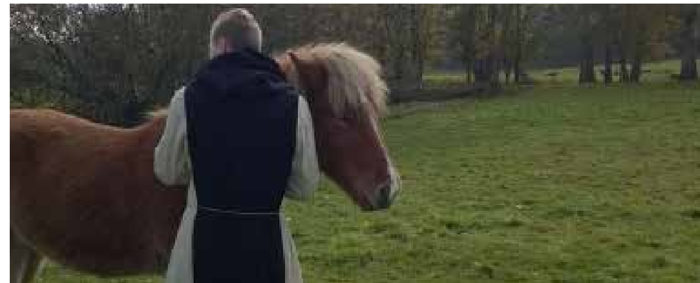
På klostret havde de får og heste. Hestene var islænder heste og de var meget kæln. De var meget søde, fordi de slikkede på ens hænder og nappede.