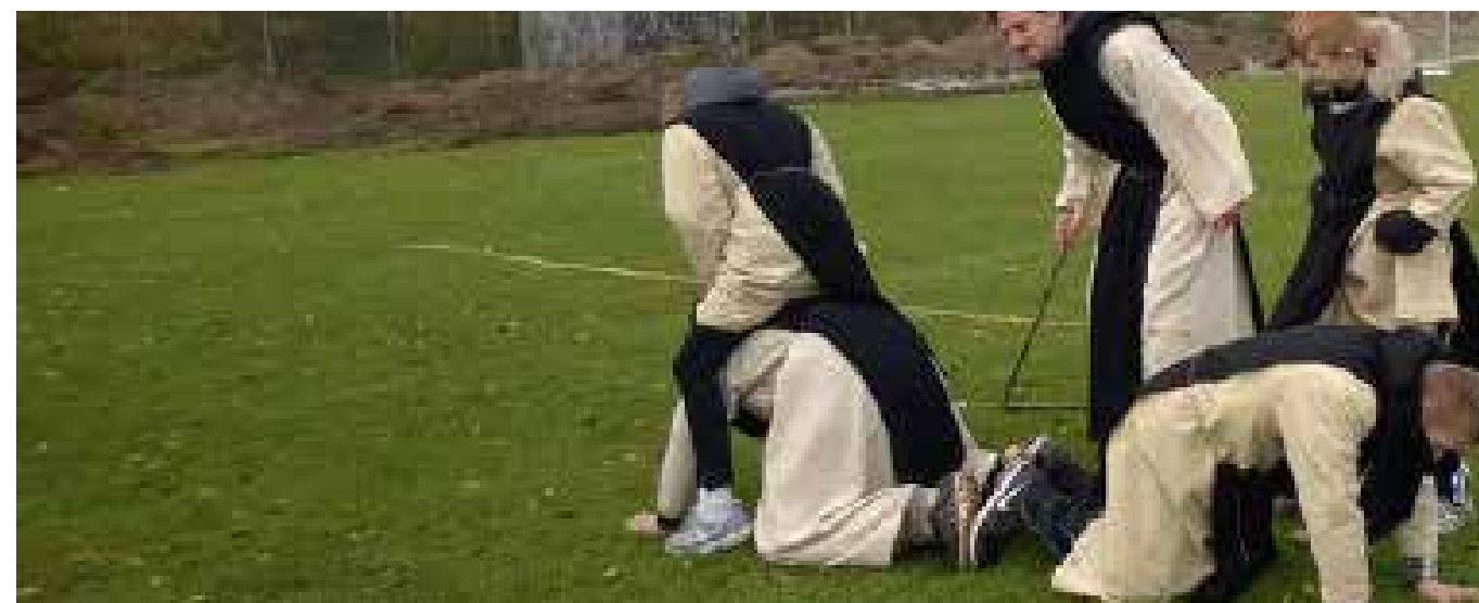
Her leger vi en okse leg. Den brugte munkene som styrketræning. Så kunne de forsvare deres kloster.