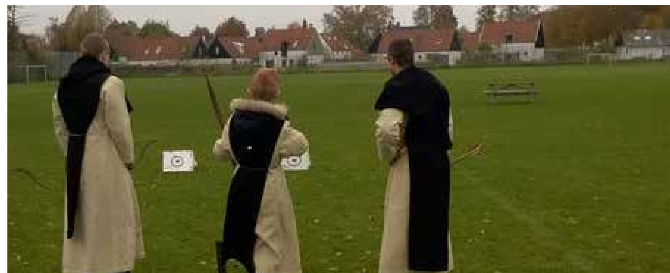
Vi skyder med buer på Esum kloster. Munkene brugte buerne til at jage med. De skulle skaffe mad fx harer, kaniner og hjorte.