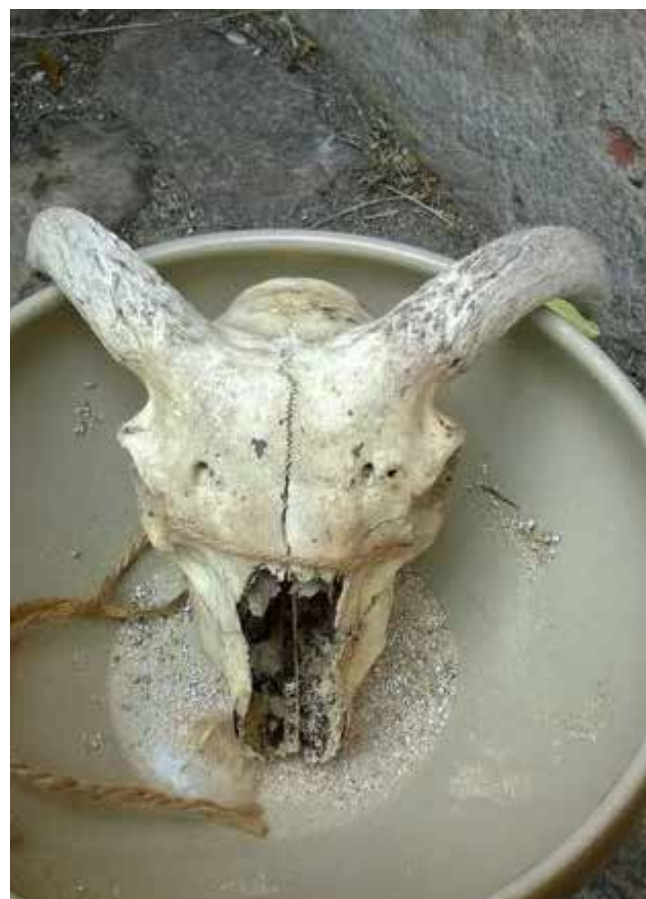
Her er et fårekranie. Det er fundet på Esum kloster.

Så gik vi i gang med de forskellige aktiviteter, hvilket I kan se og læse om på de beskrivelser, eleverne selv har lavet.