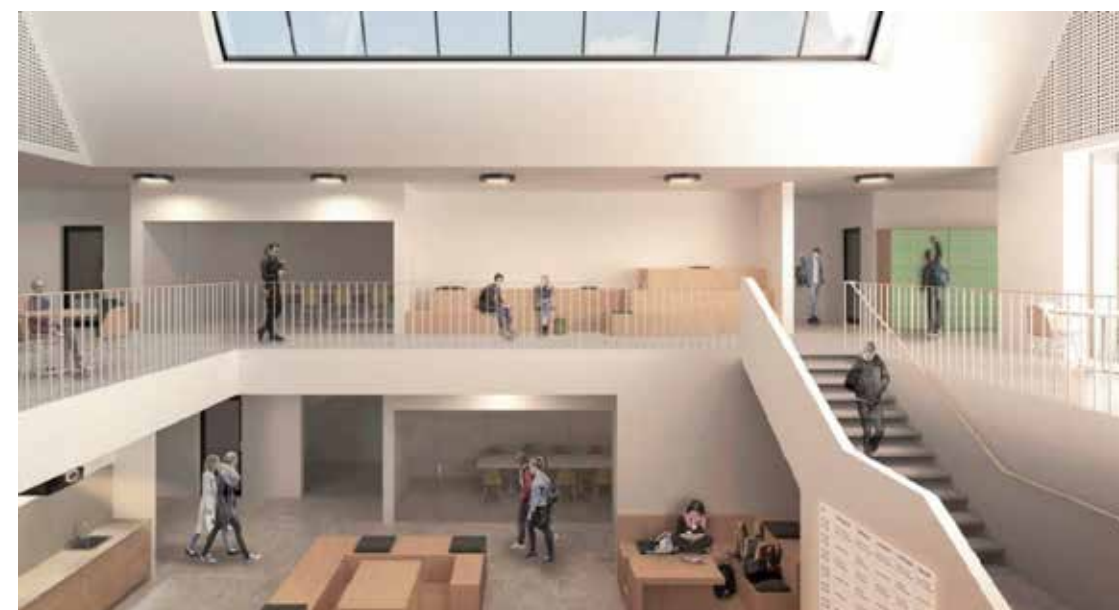
Fælles område 1 sal, bygning A