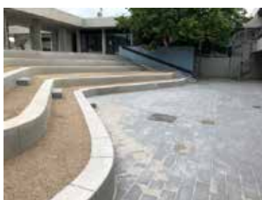
Atriumgården imellem klynge A og B står færdig, med nye belægnings og udformning

mod Parkvej – Dette har I sikkert allerede bemærket. Håndværkerne vil som udgangspunkt undgå kørsel frem og tilbage om morgenen ved afsætning af børnene, samt om eftermiddagen hvor de yngste af eleverne har fri. Flere af arbejdsprocesserne vil larme, støje og støve i periode og der vil blive gjort det bedste for at begrænse dette, så I bliver generet mindst muligt.