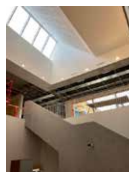
Fællesområdet i midten af klynge A tager form. Trappen er monteret. Loft- og malerarbejde er i fuld gang

Placeringen af bygningen på skolens grund betyder at vi vil have meget kørsel frem og tilbage ved parkeringspladsen