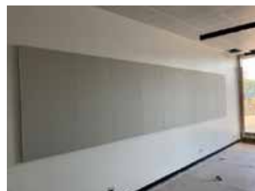
Loft, gulv og akustikplader er monteret i basislokalerne